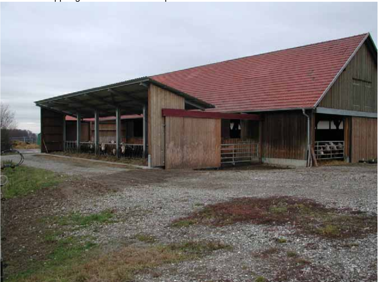
Bild 3: Nutzung einer alten Scheune als Liegehalle an die ein Aussenfressplatz mit Laufhofbereich angegliedert wurde (Mehrraumlaufstall).