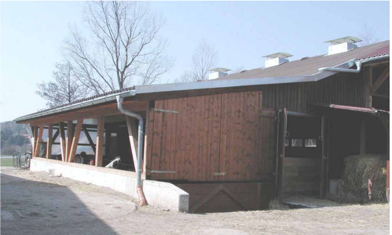
Bild 2: Anbau einer eingestreuten Liegefläche an einen ehemaligen Vollspaltenstall durch Dachanschleppung. Mit Hilfe einer Rampe kann mit Frontlader entmistet werden.