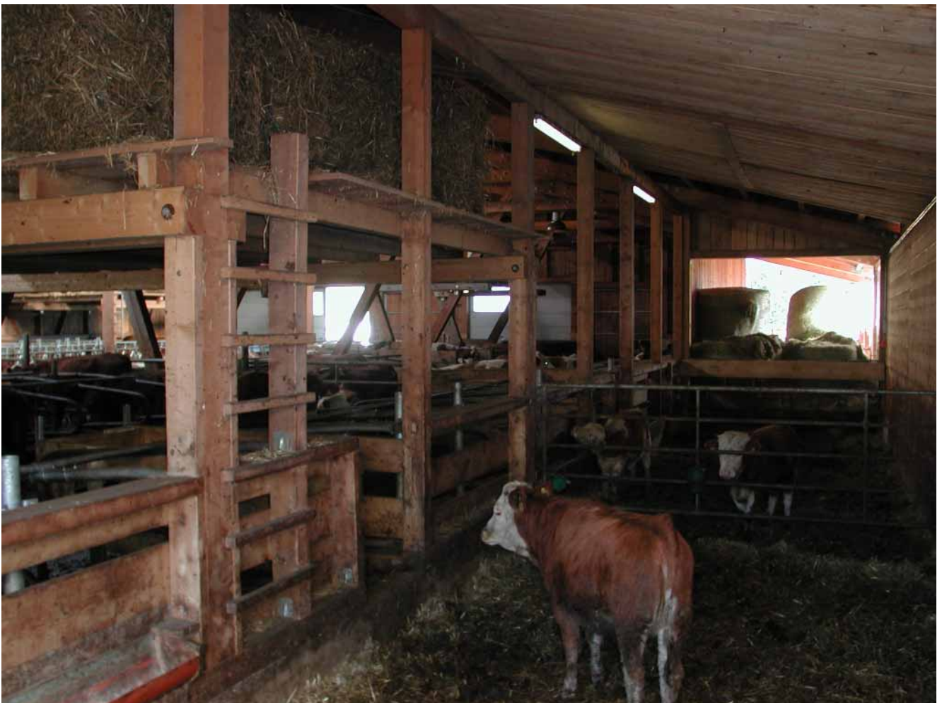
Bild 1: Befahrbarer Kälberschlupf an der Stallaussenseite zum Entmisten mit Frontlader. Ein Strohzwischenlager auf der Bühne erleichtert das Einstreuen.